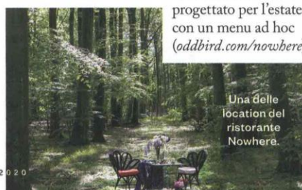
Una delle location del ristorante Nowhere.

Che ne direste di cenare nella campagna svedese, soli in mezzo alla natura? Sono le sei location nella riserva naturale di Häringe, vicino a Stoccolma, che i produttori vinicoli di Oddbird hanno progettato per l'estate con un menu ad hoc ( oddbird.com/nowhere ).