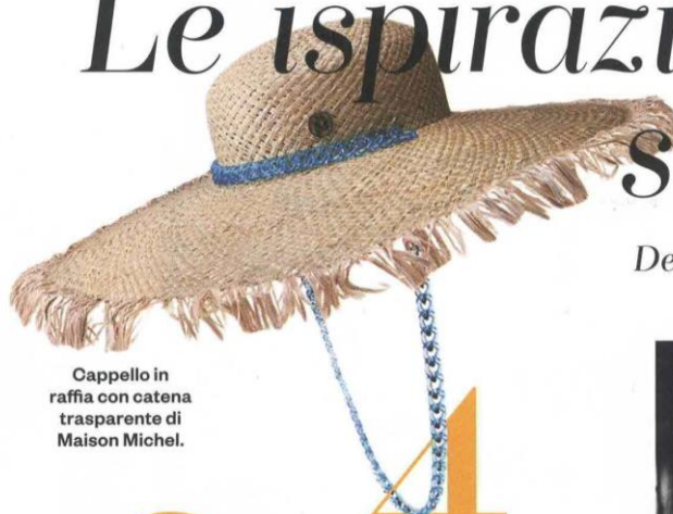
Cappello in raffia con catena trasparente di Maison Michel.

Pensate che i funghi possano appassionare solo nei libri di cucina? E invece il loro mondo si rivela molto più complesso e curioso in L'ordine nascosto . L'intelligenza dei funghi di Merlin Sheldrake (Marsilio). Dai tartufi ai funghi sciamanici, alla scoperta di un organismo misterioso.